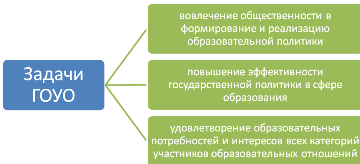
— Задачи ГОУО

Выделены три основные задачи ГОУО, показанные на рисунке 1.