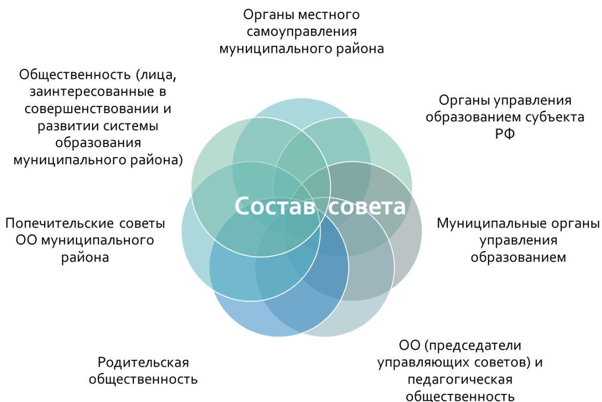
— Состав совета

районное родительское собрание; районный совет старшеклассников муниципального района; районная ученическая конференция; совет председателей управляющих советов; управляющий совет малокомплектных сельских школ; управляющий совет системы образования муниципального района.