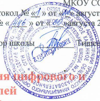
График работы центра образования цифрового и гуманитарного профилей «Точка роста» на 2024-2025 уч. год